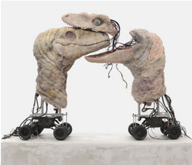
© Michele Gabriele Klicka på bild för hög upplösning