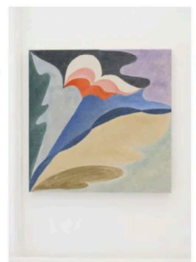
Salutation, 2023 av Vinna Begin.