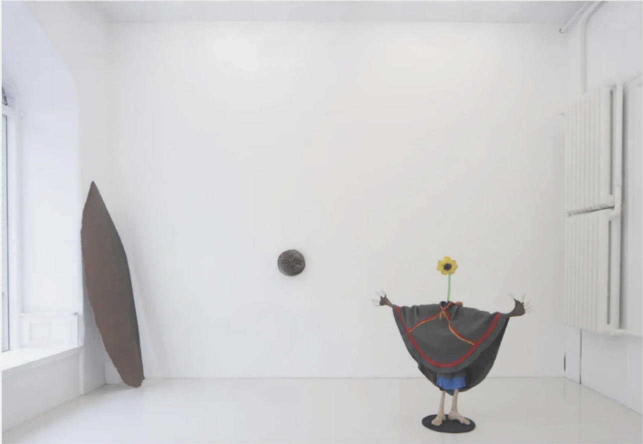
Nevven drar igång konsthösten med gruppställningen "A Potential Movement, a Movement's Potential, and a Sudden Stillness".